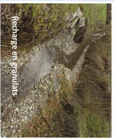
Recharge en granulats